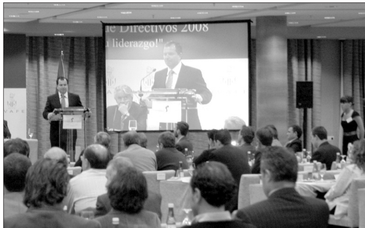
La apuesta del IVAFE por la formación empresarial se incrementa este 2008.

Uno de los primeros programas que se desarrollará este año promovido por el IVAFE es Coaching: Desarrollo profesional estratégico. El curso, de 50 horas de duración que se impartirán hasta el próximo 14 de marzo, contiene un concentrado y coherente conjunto de habilidades y estrategias que desarrollándolas permitirá incremen-