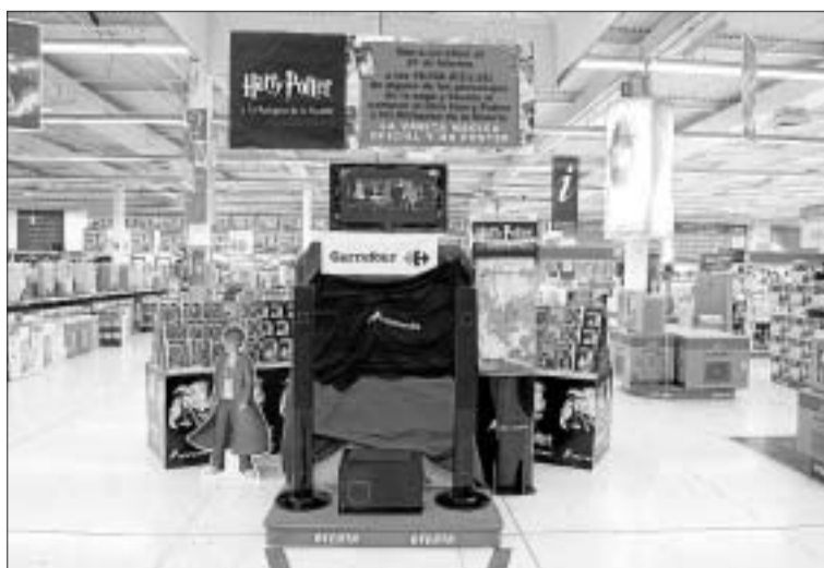
JOSÉ GARCÍA POVEDA

Aunque J. K. Rowling no ha descartado un octavo libro con las aventuras de este joven, Harry Potter y las reliquias de la muerte espera en las estanterías de las librerías y de los centros comerciales a la espera de que den las 18.30 horas y todos los lectores puedan adquirir el ejemplar y leerlo como si se tratase de la última aventura de este mago que ha conquistado los hogares de todo el mundo.