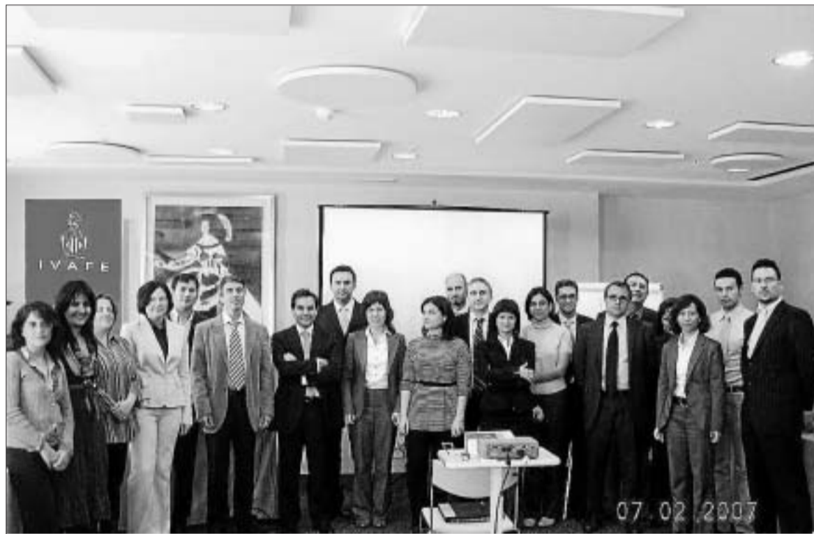
ASISTENTES. Los directivos representaban a firmas de sectores muy variados.

Este seminario forma parte de un total de diez seminarios que se van a programar dentro del Programa de Desarrollo de Directivos (PDD) del Ivafe. Este programa formativo se presentó el pasado 12 de noviembre en el mismo hotel. El acto contó con la presencia de autoridades y empresarios. Entre los presentes se encontraba el indus-