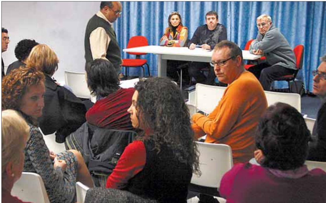
Los miembros de Projecte Obert se reunieron ayer en Burjassot.

También acordaron el apoyo en las próximas elecciones generales a los candidatos que ganaron las primarias convocadas por Izquierda Unida frente a los