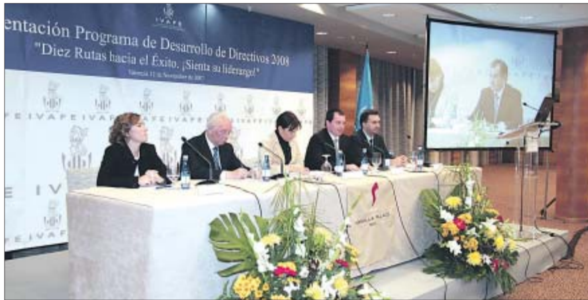
PRESENTACIÓN. El programa fue presentado ante más de un centenar de empresarios y directivos.